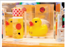
「在大型浴池 泡泡澡...」