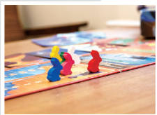
如做夢般沉醉在 各國遊戲中...