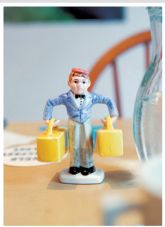
要不要吃點 美味早餐呢？