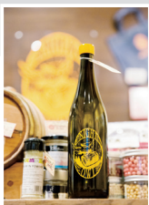
「買宋化或是 葡萄酒...」